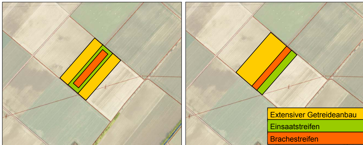
Abbildung 1: Schematische Zeichnung Muster Artenschutzfenster Kartengrundlage: Geobasisdaten der Kommunen und des Landes NRW © Geobasis NRW

Zielarten: Feldvögel (z.B. Grauammer, Rebhuhn, Feldlerche, Schafstelze, Goldammer), Feldhase, Ackerwildkräuter